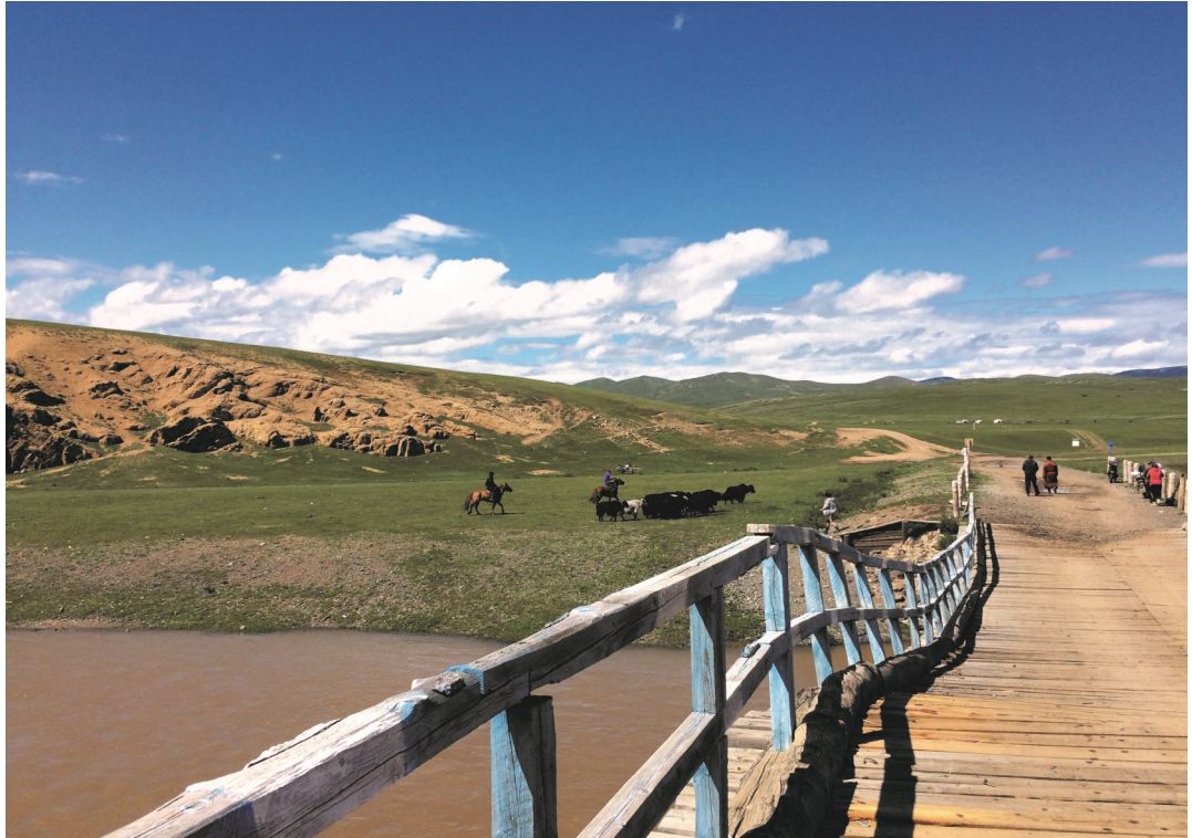
Khangay Sud (Mongolia), 2016. Fotografia di M. Venturelli