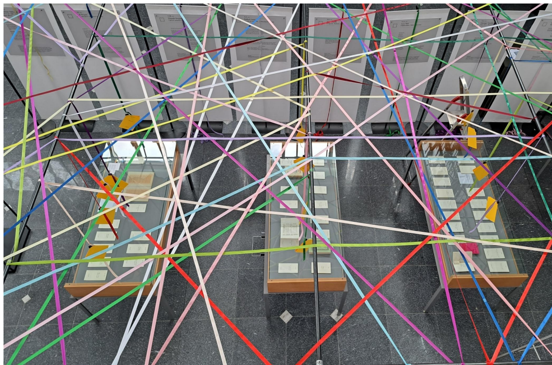
OPLEPO in biblioteca, anche. 35 anni dell'Opificio di letteratura potenziale. Mostra ed eventi collaterali 2 ottobre – 13 novembre 2025.